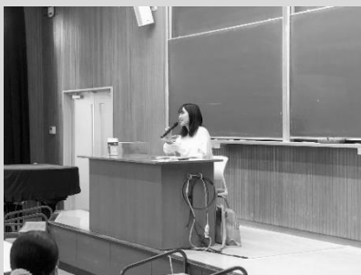
合格者体験談の様子

公務員講座を受講して合格した先輩達による、後輩受講生のサポート活動も行っています。2023年度においては、合格者体験談、試験内容の情報提供、合格体験記作成等を行いました。先輩たちも全力で皆さんの夢をサポートします！