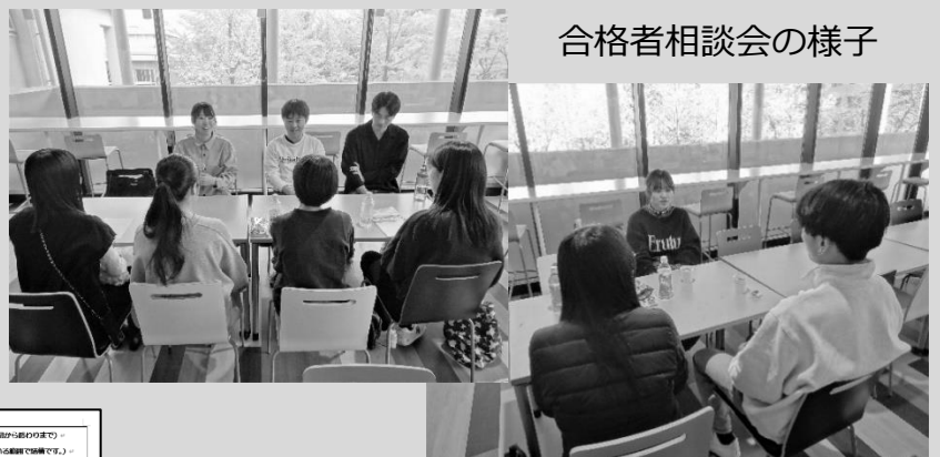
合格者相談会の様子