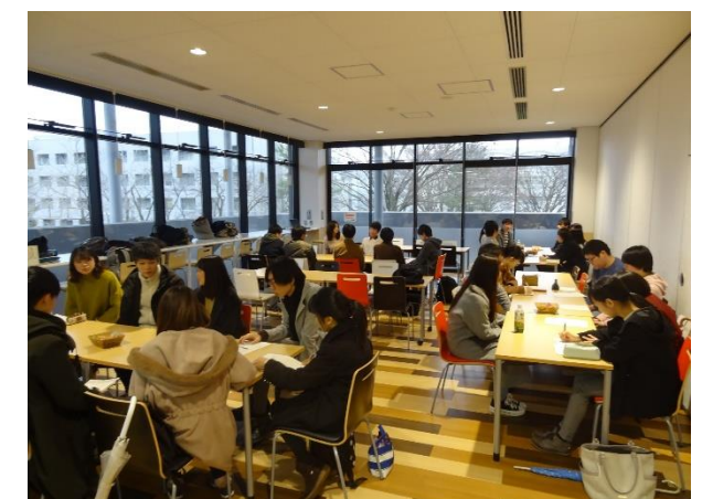
先輩内定者による相談会