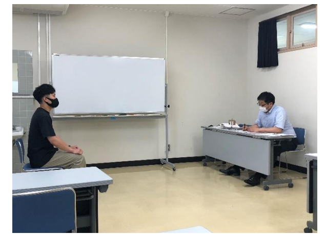
個別面接対策(2次試験対策)