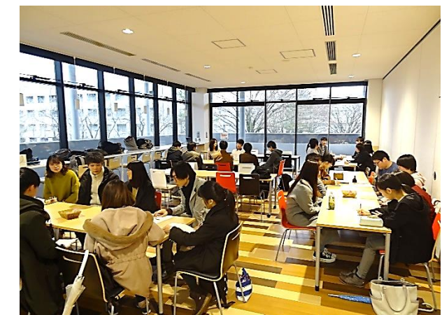
先輩内定者との交流会