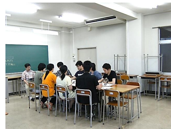
集団討論対策 (2次試験対策)