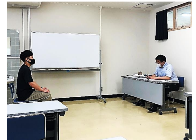
個別面接対策 (2次試験対策)