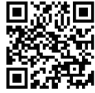
プログラム紹介動画

毎日朝食3食付き・数回のコースディナー(正装での参加) アクティビティ・エクスカージョン参加時は、現地でランチ提供あり