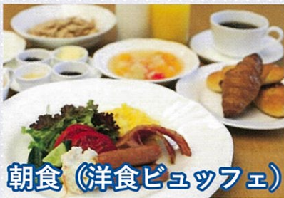
朝食 (洋食ビュッフェ)