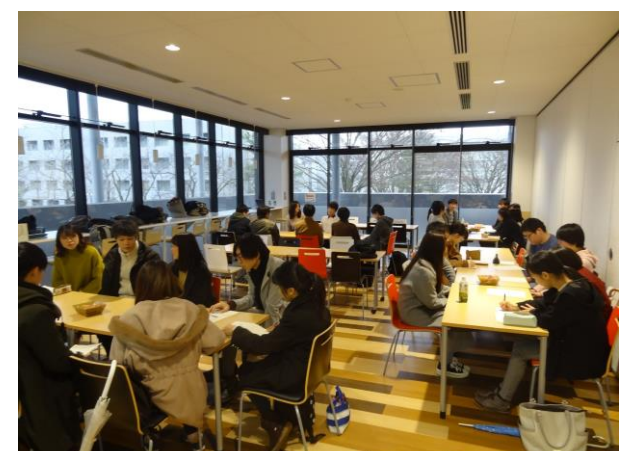
先輩内定者による相談会