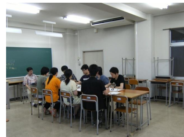
集団討論対策 (2次試験対策)