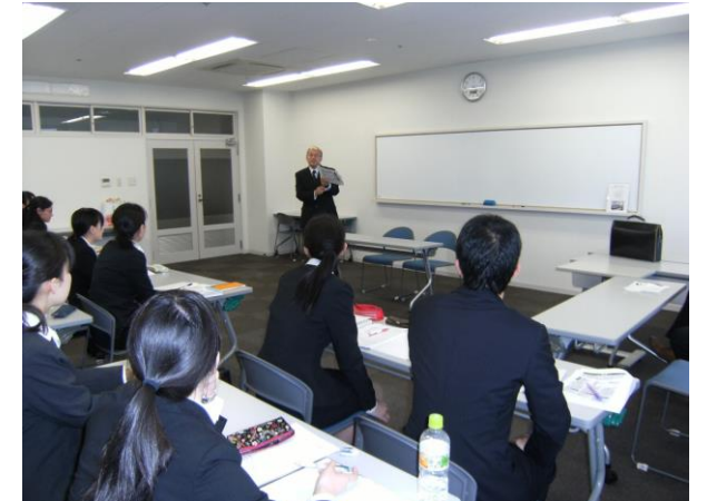
他大学との合同面接練習会